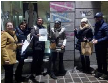
Monza, raid notturno antiwriter a Monza

Monza - Raid notturno antigrffiti a Monza. Oltre una trentina i membri del progetto "Fight the writers" che venerdì si sono dati appuntamento a mezzanotte al Ponte dei Leoni per combattere a modo loro il degrado della città.