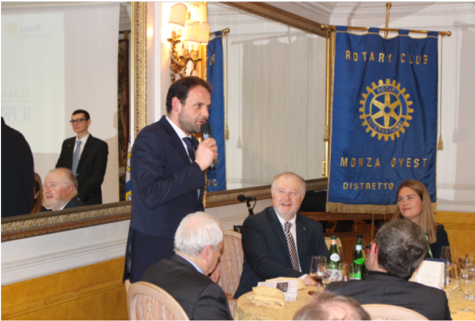
(Nella foto: l'intervento di S.A.S. Marcello I)

principali avvenimenti chiave (dalla donazione ai monaci di Lerins, passando per l'apertura della Zecca fino alla vendita ai Savoia) e spiegando le motivazioni storiche per le quali Seborga sostiene di essere indipendente dall'Italia.